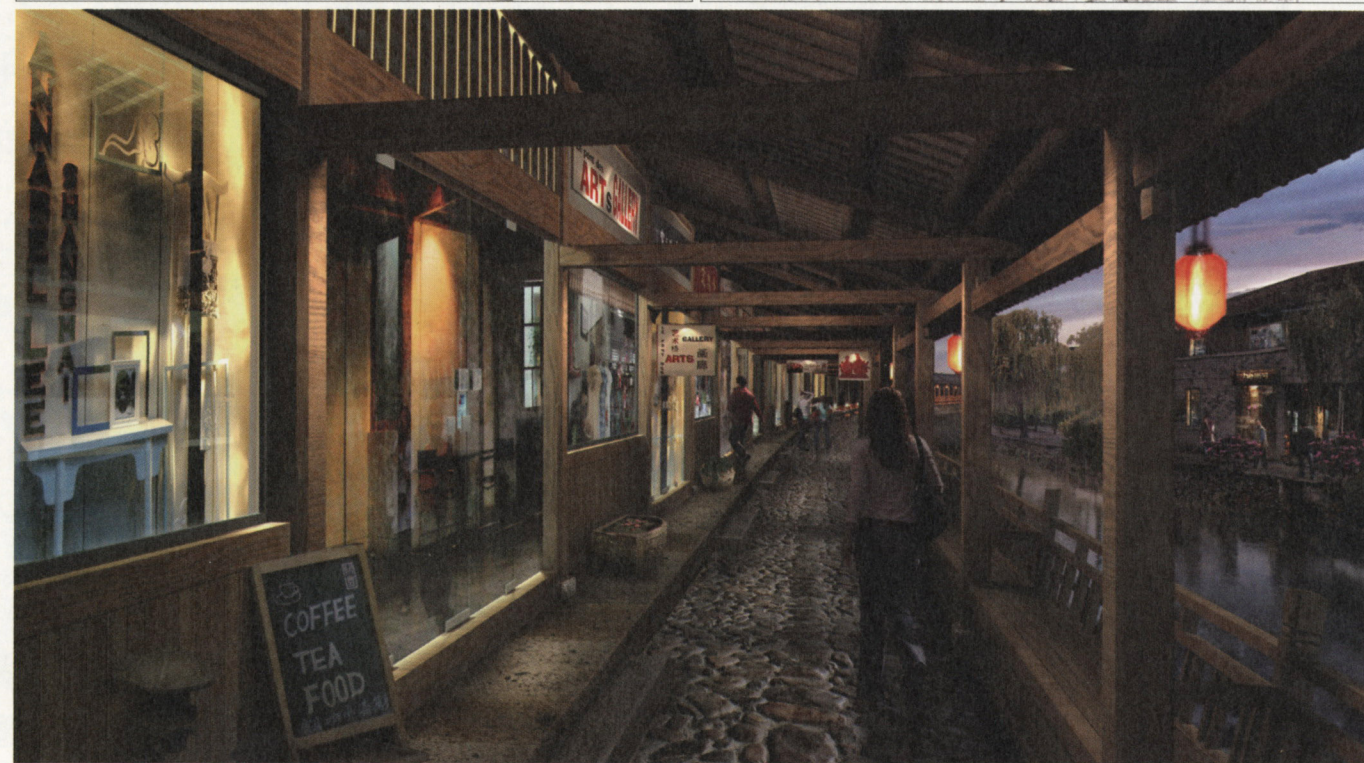
1 楠溪江文化创意产业园项目区域图 / 2 丽水街改造后效果图 /